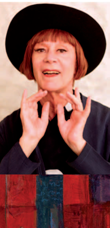
Figure e figurine di una italietta arrancante nella storia dove le canzonette fanno la parte del leone. Accanto a Poli gli attori che da sempre lo accompagnano in un tipo di teatro personalissimo. Le scene del grande Luzzati enfatizzano la pittura novecentesca. I costumi fantasiosi di Cali sorprendono ancora una volta. Le musiche di Perrotin persuadono arditamente. Insomma una nuova produzione della premiata ditta Sorrisi e Veleni.

Ad una rilettura odierna sembrano piuttosto rievocare la teatrale tenerezza del Tasso o la cinematografica leggerezza dell'Ariosto. Gli avvenimenti narrati sono visti attraverso il ricordo struggente: l'infanzia infelice ma luminosa l'adolescenza insicura, ma traboccante, l'amore sfiorato ma mai posseduto. Sentimenti che ricordano il dispettoso rifiuto di Kafka e le illuminazioni improvvisate di Joyce.